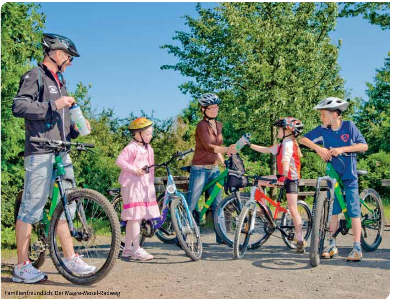
Familienfreundlich: Der Maare-Mosel-Radweg