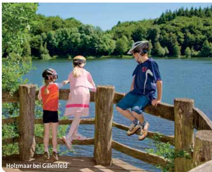
Holzmaar bei Gillenfeld

Schienenbusfahrten im 2-Stunden-Takt, von Mai bis Oktober an allen Wochenenden und Feiertagen zwischen Gerolstein, Daun, Ulmen und Kaisersesch, vom 01.07. bis 31.08.2011 sogar täglich zwischen Gerolstein, Daun und Ulmen, kostenlose Fahrradmitnahme, Fahrkartenverkauf direkt im Zug, Bewirtung mit kühlen Getränken. Fahrplaninfos unter www.eifelquerbahn.de